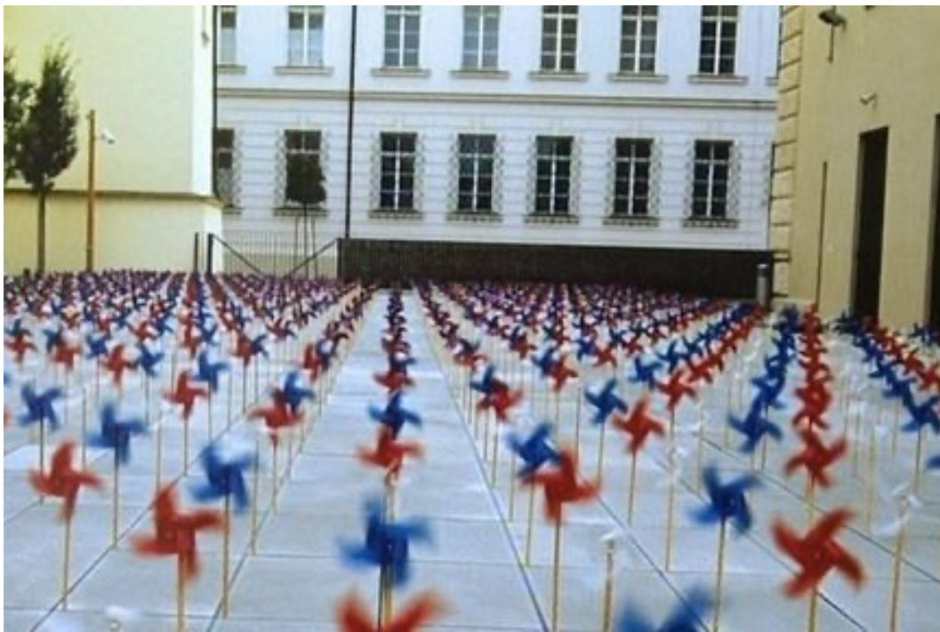
VĚTRNÍKY MEZI DLAŽEBNÍMI KOSTKAMI