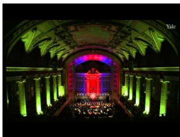
Alexandr Skrjabin: Prométheus – Báseň ohně

Kdyby žil Jules Verne ještě o několik let déle, určitě by mu neušel odvážný nápad dalšího hudebního vynálezce – ruského skladatele Alexandra Skrjabina , který se roku 1910 rozhodl, že do svého díla Prométheus – Báseň ohně , zapojí světelný klavír (propojení kláves klavíru s konkrétním světlem). To byl vzhledem k tehdejším technickým možnostem náročný požadavek, a tak se tento projekt dočkal řádné realizace až o sto let později.