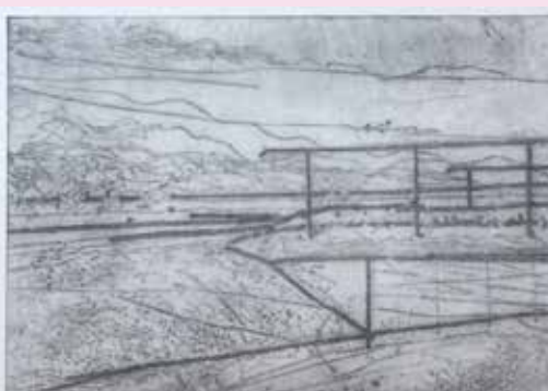
A. Kučerová: Ráno (1985)