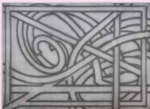
A. Kučerová: Hud. motiv č.3 (1978)

Náměty pro svou práci nalézala v krajině, v běžných lidských činnostech, často dělala lidskou figuru - mnoho jejich děl znázorňuje například plavce a vodu, ale tvořila i abstraktní obrazy inspirované hudbou.